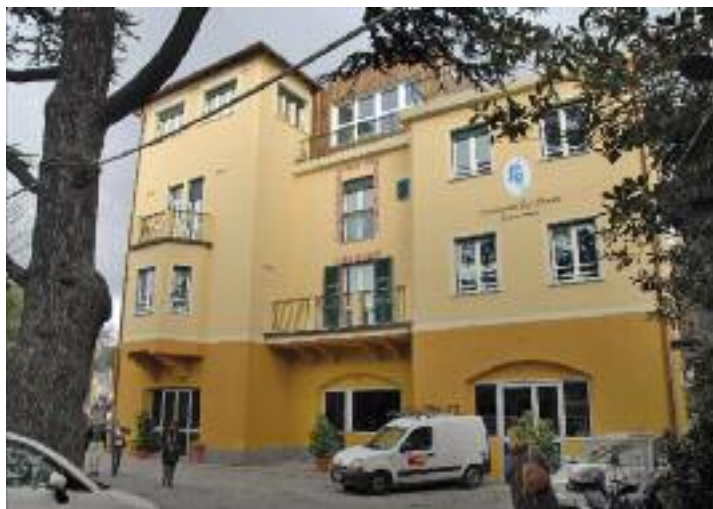
Edificio dell'Hospice di Albaro.