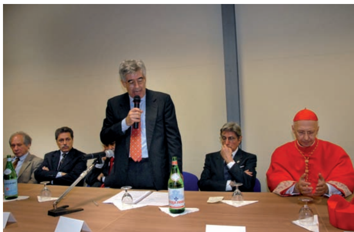
Due momenti dell'inaugurazione Hospice "Gigi Ghirotti di Albaro", 24/11/2009