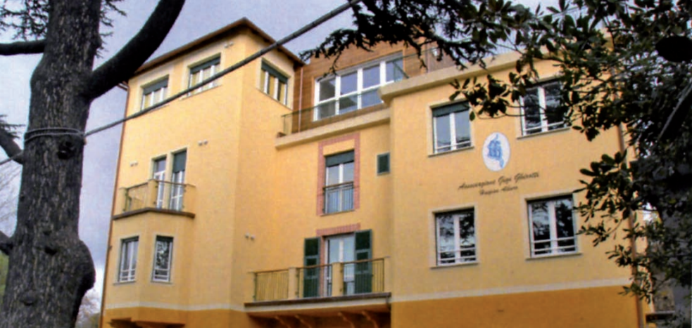
Edificio dell'Hospice di Albaro

e di coordinamento di tutta l'attività, la preparazione dei Corsi per la formazione dei volontari e la preparazione per gli incontri di aggiornamento sulla terapia del dolore e sulle cure palliative.